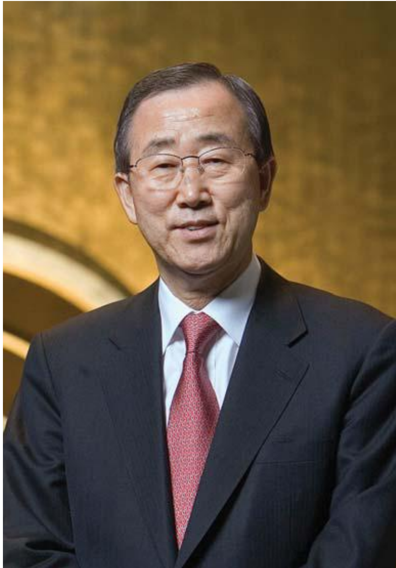
Ban Ki-moon Secretary-General of the United Nations United Nations Headquarters, New York, October 2007